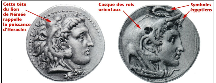
Cette tête du lion de Némée rappelle la puissance d'Hercules

Plutarque, Vie d'Alexandre , II e siècle après J.-C.