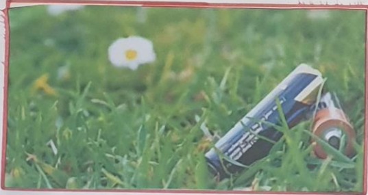
Pour aider la planète il faut adopter des gestes simples comme jeter nos piles dans une poubelle recyclable.