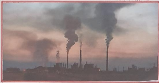
la combustion du charbon, du pétrole et du gaz