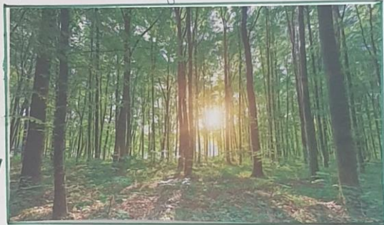
les arbres contribuent à réguler le climat en absorbant le CO2.