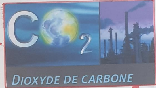
produit du dioxyde de carbone.