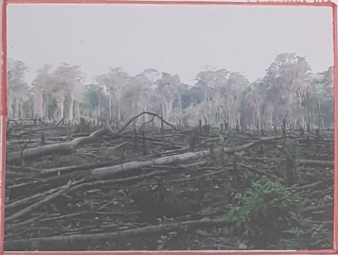
Mais la déforestation l'en empêche.